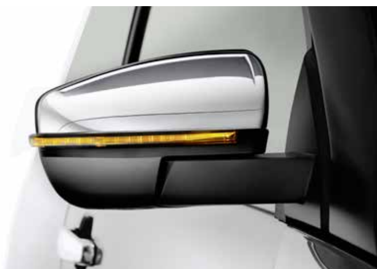
Aussenspiegel mit LED-Blinker, Serie ab Premium